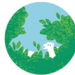
AP 6 Landschaftspflege- herde