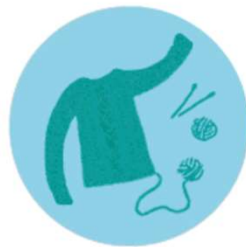
AP 3 Weidewolle