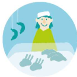
AP 1 & 2 Lammfleisch- vermarktung B2B und B2C

Unsere Aufgaben sind in 7 Arbeitspakete (AP) unterteilt: