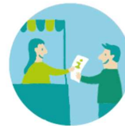
AP 7 Kommunikation und Öffentlichkeitsarbeit