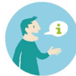
AP 5 Beratung und Netzwerk