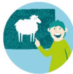
AP 4 Weiterbildungen